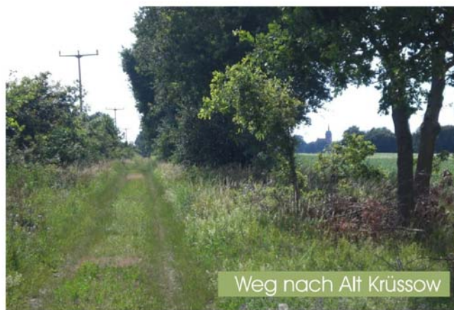
Eine Information der Initiatoren des Annenpfades: Fördervereins Wallfahrtskirche Alt-Krüssow e.V., des Fördervereins Bölzker Kirche e.V., und des Kloster Stift zum Heiligengrabe mit freundlicher Unterstützung des Tourismusverbandes Prignitz e.V. Stand Februar 2010